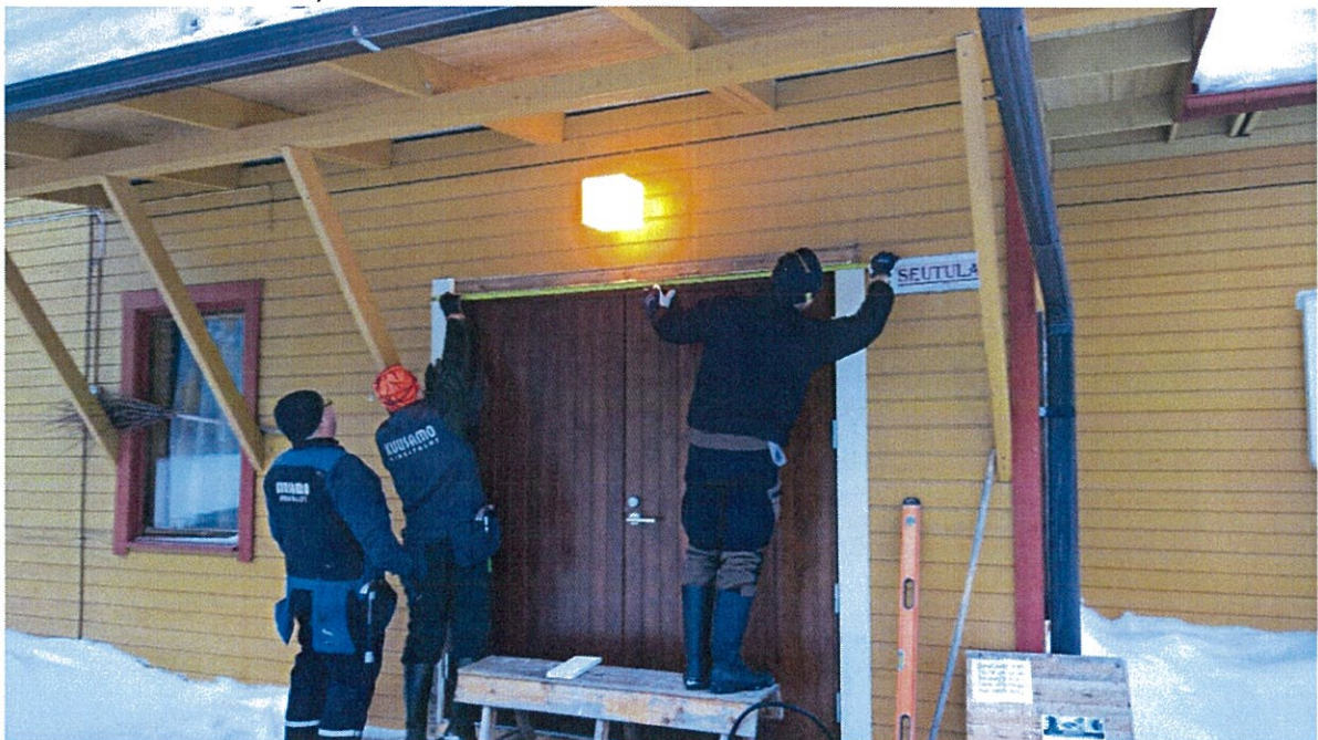
Ulko-ovien asennusta, helmikuu 2017

Väkimmäärältään suurimpia vuotuisia tapahtumia ovat Hautajärvi-päivä Sallaviikkojen aikaan 15.7. sekä paikallisten metsästyseurojen hirvipeijaiset.